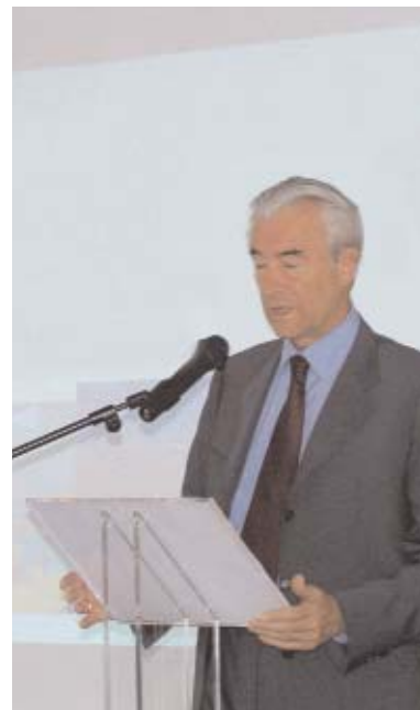
Gilles de Robien répond aux journalistes le 9 novembre dernier : « Je ne suis pas derrière SOS Éducation ». L'indépendance de l'association gêne beaucoup ses opposants.

Du côté des syndicats, l'inquiétude domine. Certains vont jusqu'à imaginer un complot entre Gilles de Robien et SOS Éducation. « Les syndicats les soupçonnent d'avoir porte ouverte au ministère depuis quelques mois » a écrit le Figaro . A tel point que le ministre de l'Éducation a été obligé de se justifier : « Je ne suis pas derrière SOS Éducation. Je suis trop soucieux et respectueux de la liberté associative pour ne pas me mêler des messages qu'elle compte défendre », a-t-il répondu le 9 novembre aux journalistes. Et c'est bien la totale indépendance politique de SOS Éducation qui gêne ses ennemis : elle n'est le pantin de personne et existe uniquement grâce à ses 64 000 membres. Si elle fait du bruit, c'est parce qu'elle répond aux attentes des parents et des professeurs du secondaire, qui écotent des élèves qui n'ont pas appris à lire et à écrire au primaire. C'est parce qu'ils souffrent de cette situation qu'ils sont prêts à soutenir toutes les actions qui favoriseront le retour au bon sens à l'école.