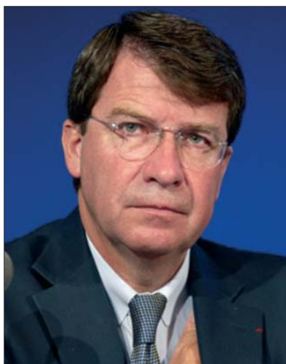
► Photo de droite : la campagne de SOS Éducation contre la semaine de 4 jours a porté ses fruits.