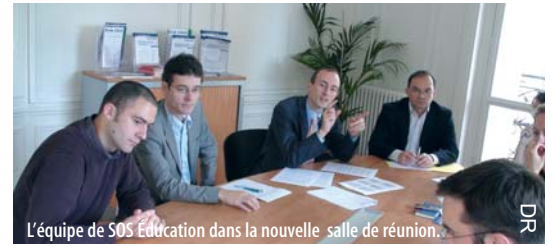
L'équipe de SOS Éducation dans la nouvelle salle de réunion.

L'équipe de SOS Éducation prenant une nouvelle dimension (quatorze personnes, dont cinq nouvelles depuis le début de l'année), l'association a été obligée de quitter le local rue Jean-Marie Jégo, dans le 13 e arrondissement de Paris, qu'elle occupait depuis 2005. SOS Éducation est désormais installée 120, boulevard Raspail à Paris. Tous les membres de l'association sont cordialement invités à venir visiter les nouveaux locaux, qui comptent désormais une salle de réunion.