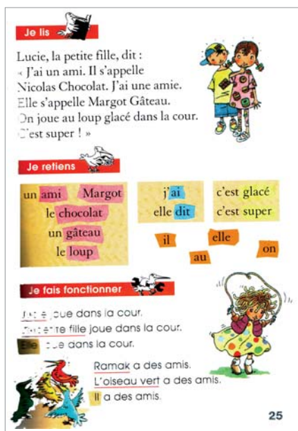
► Extrait de "Abracadalire", manuel de lecture globale contre lequel SOS Éducation a fait campagne dans "Les 5 pires livres de classe".

En écriture, pas question de faire des lignes, jugées trop répressives. Chaque enfant écrit ses lettres et ses chiffres selon son humeur. Sans surprise, la plupart font des pattes de mouche qu'ils n'arrivent souvent pas à relire eux-mêmes. Pour la suite de leur scolarité, c'est un handicap qui peut avoir des conséquences graves. En calcul, l'étape certes pénible, mais ... Suite page 6