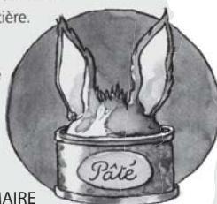
Illustration de Nathalie LEMAIRE

> Le nouvel atelier de français, CE1 , éditions Bordas, p. 13.