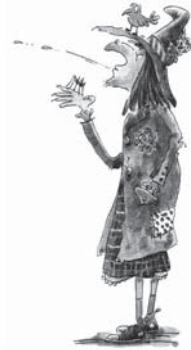
Une héroïne du Nouvel atelier de français , édition Bordas, p. 25.

> Le nouvel atelier français , CE1, éditions Bordas, p. 41.