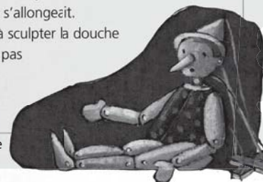
Illustration de Laure Emmanuelle DELVAL

> Le nouvel atelier de français, CE1 , éditions Bordas, p. 92.